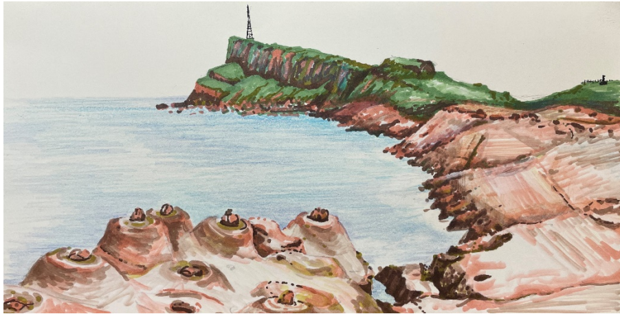
圖 3 自備照片或是素描、手繪簡圖等(請務必註明出處，包含繪製者與繪製時間和地點)