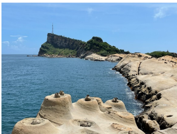
圖 1 台灣地景保育網任選一張地景的照片或自行拍攝或選用照片(請務必註明出處)